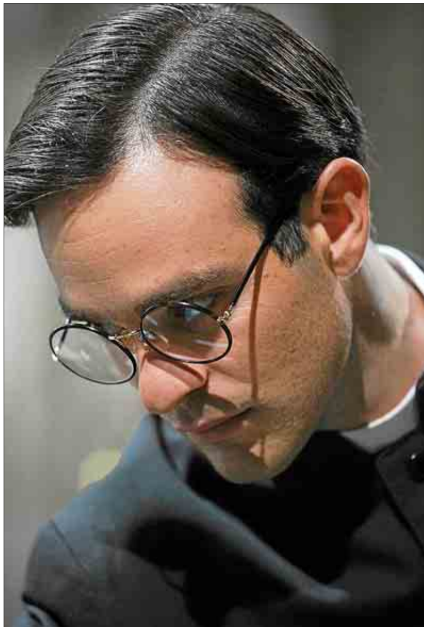
El actor Charlie Cox en un momento de 'Encontrarás dragones'.

P. — Como en el caso de La misión —donde ayudó como consultor de